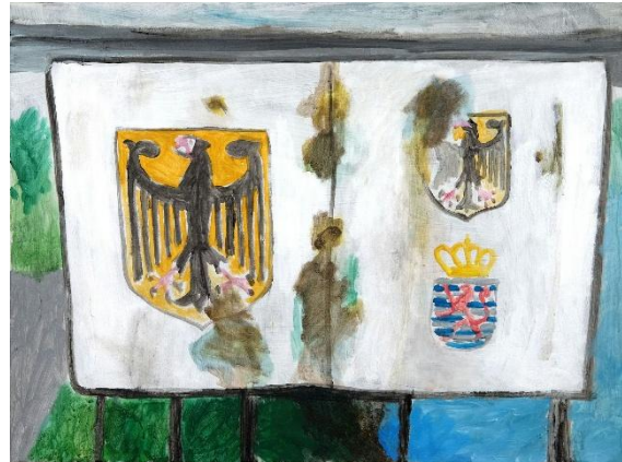
Abbildung 2 Silke Marefka „Grenzübergang Nennig an der Mosel“

Ein Europa der offenen Grenzen. Das war nicht nur ein Traum, sondern einige Jahre lang Realität. Die Schlagworte dazu hießen „Schengen I“ und „Schengen II“. Diese europäischen Übereinkommen führten dazu, dass von 1985 bis 2008 Stück für Stück die Schlagbäume an den insgesamt neun Ländergrenzen von Deutschland verschwanden.